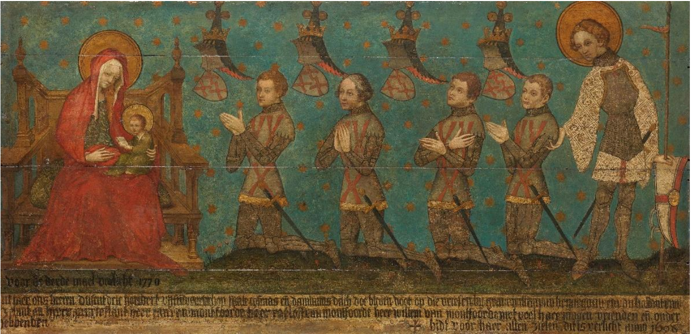
Memorievoorstelling met leden van de familie De Rover, heren van Montfoort (14 e eeuw), Rijksmuseum, Amsterdam.